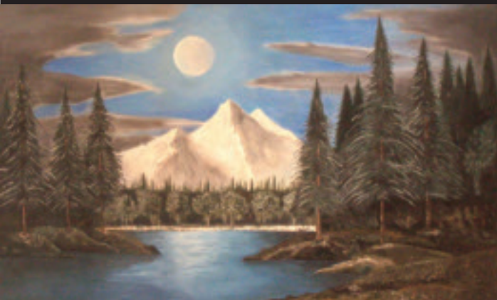
"La Notte" - 100x60