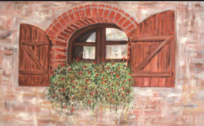
"La Finestra" (Premio Padova 2009) - 100x60

È consigliato visitare il suo sito web www.paolocaloi.it per poter ammirare la sua "Galleria".